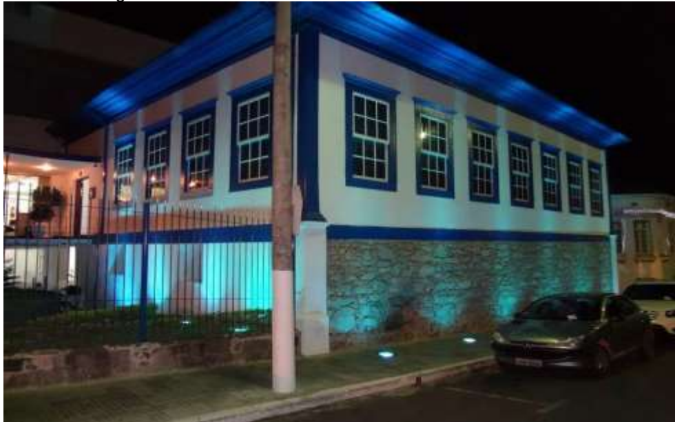
Figura 4: Fachada restaurada do Prédio Central da UNIFEI