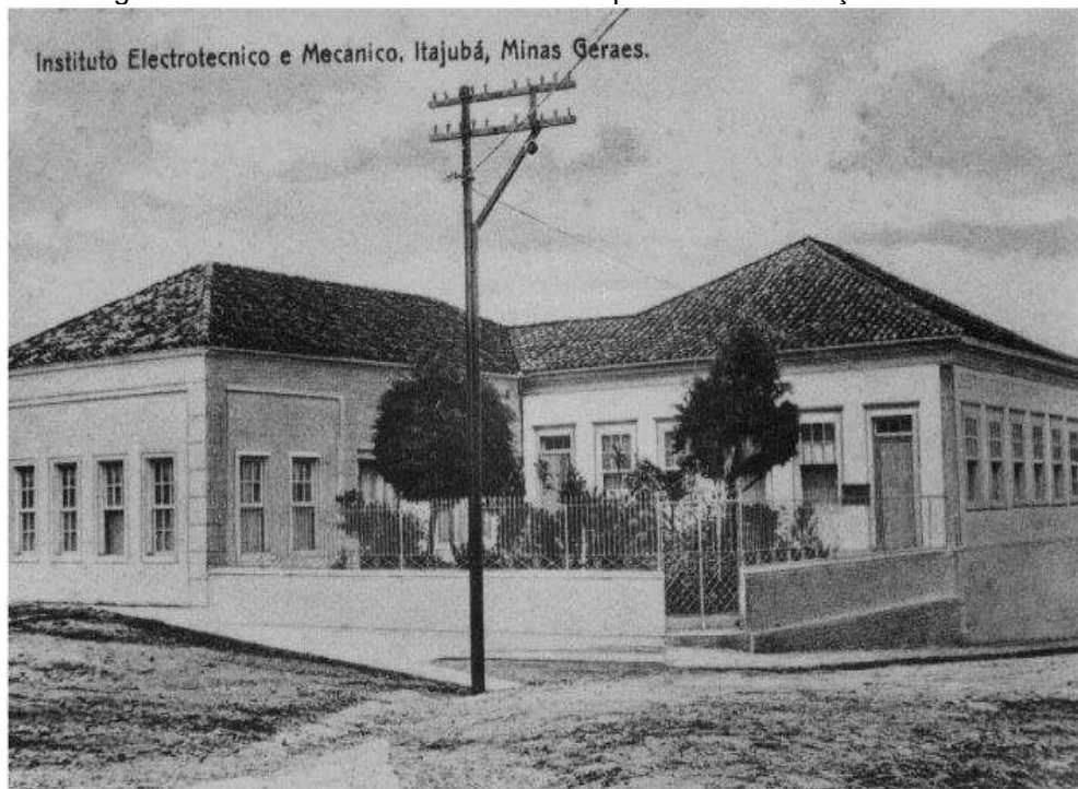
Figura 3: Primeira sede do IEMI nos tempos de sua fundação em 1913