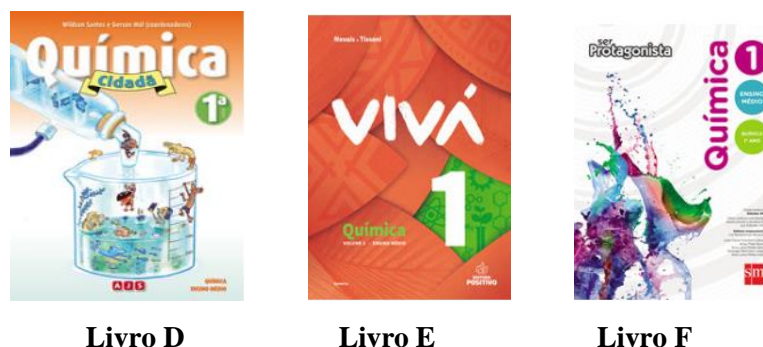
Figura 3.1 – Coleções de Química aprovadas pelo Programa Nacional do Livro e do Material Didático (PNLD) no ano de 2018.